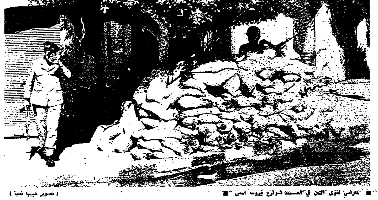
تزامن لقوى الأمن في احتلال شوارع بيروت امس